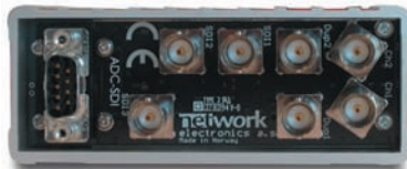
背面：ADC-SDIコンバータを装着した例